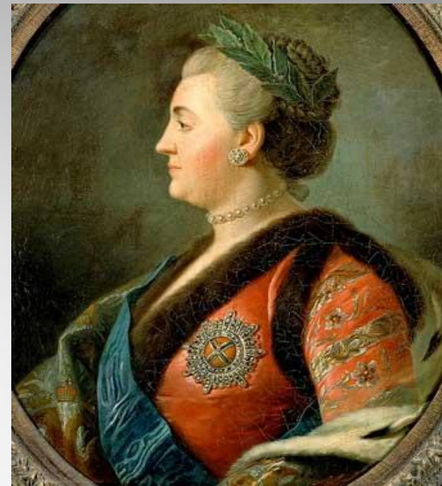
Екатерина II Великая 1762-1796