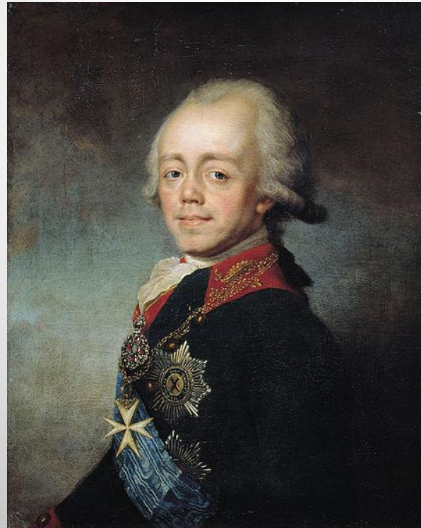
Павел I Петрович 1796-1801