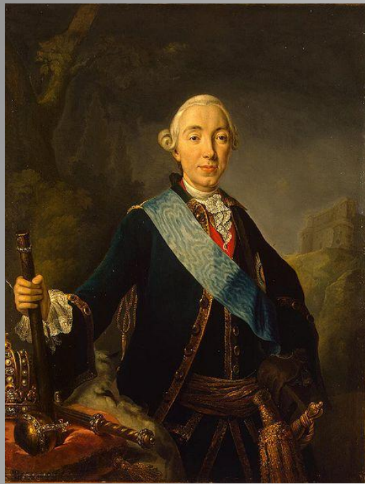
Пётр III Фёдорович 1761-1762